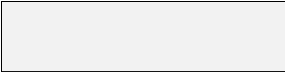
Слика 6 Наслов слике